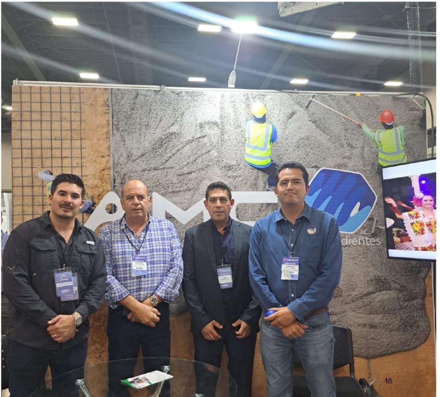
Presidente y socios AMCI